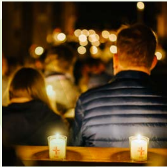
Osternacht im Hohen Dom zu Paderborn